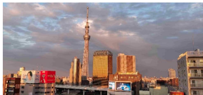
Asakusa-Viertel in Tokyo

2.Tag Ankunft in Tokyo. Bei Buchung des Gruppenfluges ab München; Transfer mit Ihrer Reiseleitung vom Flughafen zu Ihrem Hotel. Alternativ Flug ab/bis allen Flughäfen in D/A/CH nach Tokyo und individueller Transfer zu Ihrem Hotel.