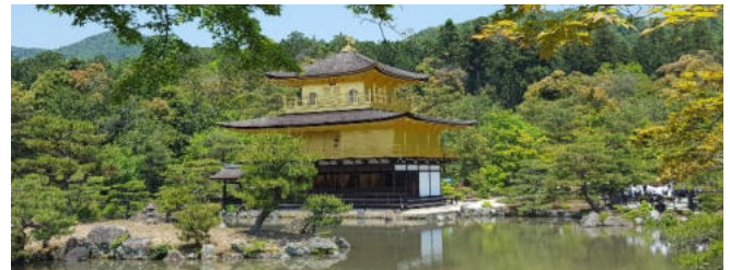
„Goldener Pavillon“ in Kyoto

einen Stopp bei einer der wenigen im Original aus dem 16. Jahrhundert erhaltenen Burgen Japans in Hikone . Vom Burghügel aus lässt sich auch das größte Binnengewässer Japans erspähen. Der Biwa-See , mit mehr als 670 Quadratkilometern Fläche und bis zu 104 Metern Tiefe, schmiegt sich wie ein glänzendes Seidentuch in die sanft geschwungenen Hügelketten der Umgebung. Von Maibara aus nehmen Sie das pünktlichste und sicherste Verkehrsmittel der Welt nach Kyoto: den Shinkansen Superexpresszug. Dieser braust seit mehr als 60 Jahren mit Höchstgeschwindigkeiten über 250 km/h unfallfrei und nachhaltig auf einem vollkommen eigenen Schienennetz durch das Land und erfüllt Japaner bis heute mit Stolz. Sauberkeit, Pünktlichkeit und Technik werden auch Sie begeistern. Nach der Ankunft steigen Sie kurz in eine Regionalbahn um und erreichen direkt das bekannteste Shinto-Heiligtum Japans, den Fushimi-Inari-Schrein . Seine schier endlosen zinnoberroten Schreintor-Galerien laden zu einem Spaziergang ein und gehören zu den beliebtesten Fotomotiven Japans. Weiterfahrt nach Kyoto und Übernachtung im Hotel.