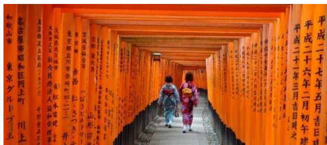
Besuch des Fushimi Inari-Schreines

Von Nagano geht es morgens nach Shirakawa-go , ein malerisches Dorf inmitten hoher Bergen. Die mit Reetgras gedeckten Bauernhäuser sind in einem uralten Baustil errichtet. Ob ihrer steil aufragenden Dächern werden sie auf Japanisch als „gassho“, „zum Gebet gefaltete Hände“ bezeichnet. Das gesamte Dorf ist daher 1995 als UNESCO-Welterbe anerkannt und unter Schutz gestellt worden. Nirgendwo sonst lässt sich das alte, bäuerliche Japan bei Spaziergängen schöner und eindrucksvoller erleben, als hier. Weiter geht es nach Kanazawa . Sie besuchen einen der drei schönsten Landschaftsgärten Japans: den Kenrokuen Wandelgarten. Speziell zur Kirsch- und Azaleenblüte sowie bei der Herbstlaubfärbung ist er einer der beliebtesten Reiseorte in Japan. Im historisch wunderbar erhaltenen Geisha-Viertel Higashi-Chaya laden zahllose Süßwarenmanufakturen und Restaurants zum Verweilen ein. Übernachtung im Hotel.