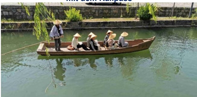
Besuch von Kurashiki

Tag 11: Tagesausflug Hiroshima im Shinkansen mit dem Railpass