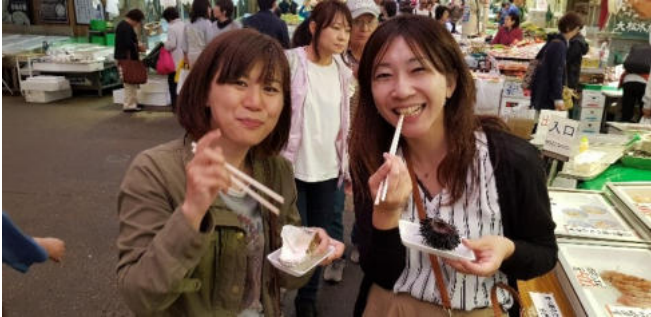
Ohmicho-Markt von Kanazawa: Austern & Seeigel

von Yamanouchi in der Präfektur Nagano. Hier können Sie mit etwas Glück die heimischen Schneeffaffen bei einem Bad in den Quellen beobachten – ein Highlight unter den Fotomotiven Japans! Anschließend geht es weiter nach Nagano , Austragungsort der Olympischen Winterspiele von 1998. Der Zenkoji-Tempel mitten in der Stadt, den sie am Abend optional bei einem Spaziergang erreichen, ist ein beliebtes buddhistisches Pilgerziel. Übernachtung in Nagano.