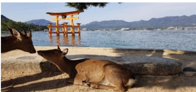
Hiroshima: Besuch der Insel Miyajima

Tag 10: (der Abreisetag Ihres Programmes) Tagesausflug Osaka mit dem Railpass