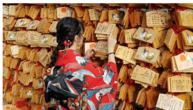
Kiyomizidera-Tempel in Kyoto

Auf dem Weg zum Tempel und im gesamten Umkreis der zahlreichen Heiligtümer können Sie die Maskottchen der Stadt, nämlich handzahme Sika-Hirsche, beobachten, die Sie auch mit „Rehkeksen“ füttern können. Ulkige Szenen mit den Wildtieren inklusive. Am frühen Abend, Rückkehr nach Kyoto.