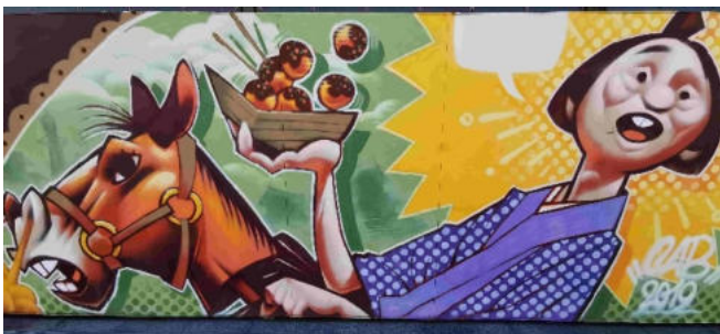
Street Art in Osaka

Tag 9: Tagesausflug Nara (Hin- und Rückfahrt mit dem Railpass)