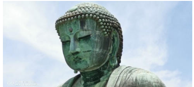
Buddha-Statue in Kamakura

kostenlos ! Unser Tokyo-Programm: Japanischer Garten im Luxushotel / Hundedenkmal in Shibuya / Blick auf die berühmte Fußgänger-Kreuzung in Shibuya / Besuch der „Food-Show“ (Lebensmittel-Abteilung eines Kaufhauses) / Besuch des Meiji-Schreines / Besuch der Aussichts-Plattform im Metropolitan Government Building in Shinjuku / Besuch in Asakusa ! Ihr ganztägiger Tokyo – Besuch kostet insgesamt ca. 10 Euro pro Person !