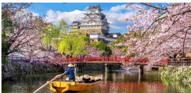
„Burg des weißen Reihers“ in Himeji

Heute abend optional: ein Japanischer Abend (Geisha-Tänze und Shabushabu-Essen): Der heutige Abend steht ganz im Zeichen traditioneller Kyotoer Kultur. In einem typisch japanischen Gasthaus genießen Sie ein delikates Shabushabu-Fleischfondue, eine japanische Spezialität mit zartem Fleisch, Gemüse, Tofu und Weizennudeln. Krönender Höhepunkt des Abends ist der charmante Besuch einer jungen Kyotoer Maiko. Die Gegenwart echter Geiko, wie Geishas in Kyoto genannt werden, ist selbst für Japaner ein immer seltener werdendes und besonderes Erlebnis. Nach kunstvollen Tänzen zu den Klängen der Shamisen steht Ihnen die Geiko für Ihre Erinnerungsfotos zur Verfügung. Sie werden live erleben, wie das alte Japan hinter der ultramodernen Fassade des Landes weiterlebt. (Der japan. Abend kann auch am 7.Tag oder am 9.Tag stattfinden.). Kosten für den japan. Abend: 179 Euro p.P.)