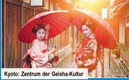
Kyoto: Zentrum der Geisha-Kultur