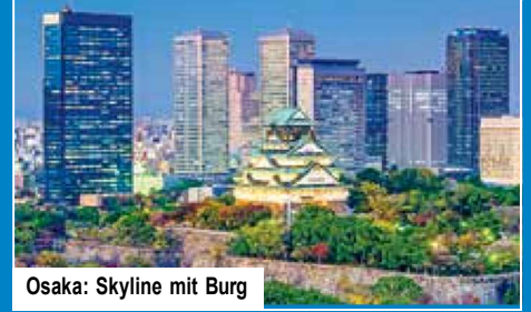
Osaka: Skyline mit Burg