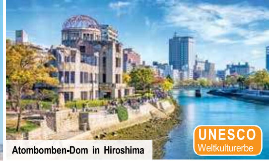
Atombomben-Dom in Hiroshima