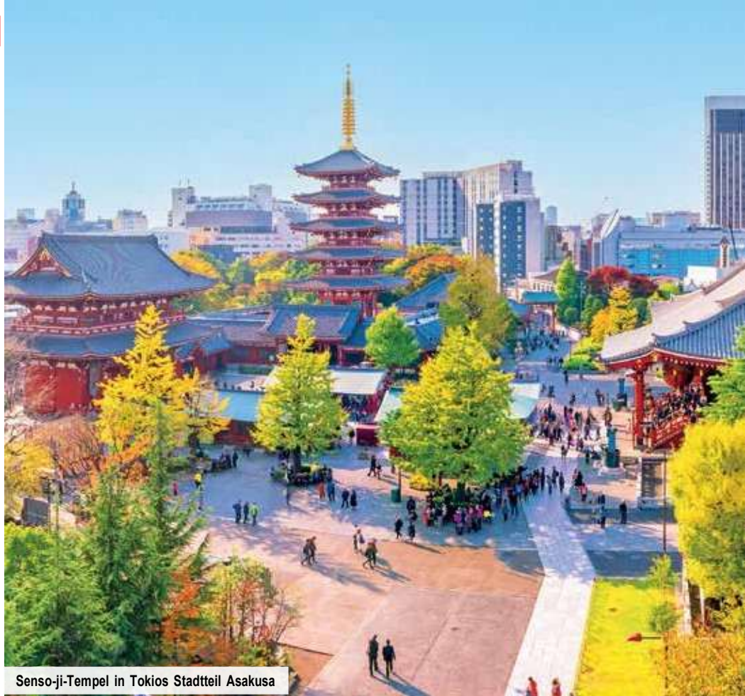
Senso-ji-Tempel in Tokios Stadtteil Asakusa