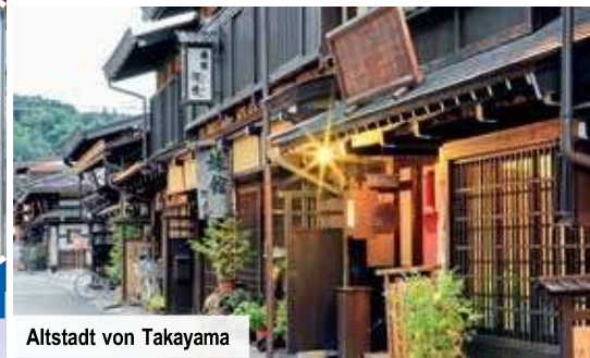
Altstadt von Takayama