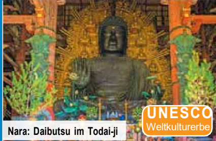
Nara: Daibutsu im Todai-ji