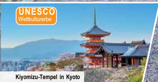
Kiyomizu-Tempel in Kyoto