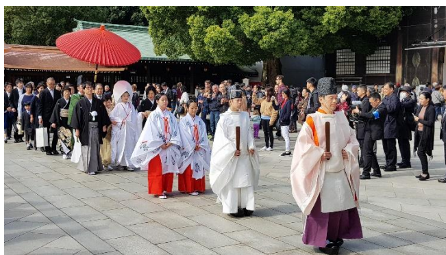
Hochzeit im Meiji Schrein

Sa 16.01.27 + Sa 30.01.27 / 2.Erlebnis-Tag Ankunft am Flughafen Narita oder Haneda. Fahrt nach Tokyo, Check-In im Hotel im Stadtteil Ginza und Übernachtung in Tokyo.