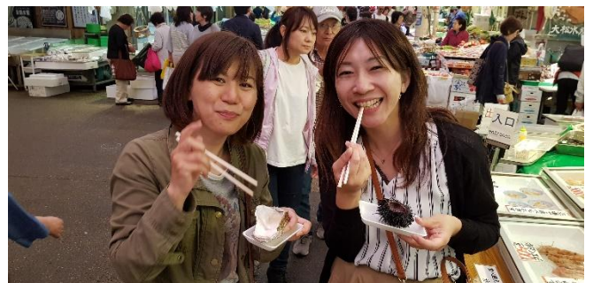
Austern und Seeigel ganz frisch ... im Ohmicho-Markt von Kanazawa

Mi 20.01.27 + Mi 03.02.27 / 6. Erlebnis-Tag: Heute unternehmen wir einen Ganztagesausflug nach Nikko . Gleich nach Kyoto steht die „Barockstadt“ Nikko auf unserer „Best of Japan“-Liste ganz weit oben. Die Tempelanlagen von Nikko gehören - völlig zu recht - zum Weltkulturerbe der UNESCO. Eingebettet in eine malerische Berglandschaft bieten die verschiedenen Tempel Fotomotive in Hülle und Fülle. Wir fahren mit dem Shinkansen von Tokyo nach Utsonomiya und dann weiter mit einem Regionalzug nach Nikko. In Nikko besuchen wir die Shinkyo-Brücke, den großartigen Toshuga-Schrein, und den Rinno-ji-Tempel (dessen jahrelange Renovierung jetzt abgeschlossen ist) oder als Alternative gleich gegenüber einen schönen japanischen Garten.