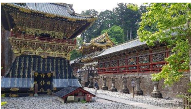
Unvergleichlich schön: die „Barockstadt“ Nikko

Do 21.01.27 + Do 04.02.27 / 7. Erlebnis-Tag: Tokyo-Kyoto Heute legen wir die 513 km lange Bahnstrecke von Tokyo nach Kyoto im Shinkansen ohne Umsteigen in 160 Minuten zurück; mit etwas Wetter-Glück haben wir unterwegs nochmals einen schönen Blick auf den Mt.Fuji. Nach Ankunft in Kyoto checken wir in unserem Hotel in Bahnhofsnähe ein. Am Nachmittag hat der stadtnahe Fushimi Inari-Schrein die besten Lichtverhältnisse zum Fotografieren. Der Schrein mit seiner kilometerlangen Tori-Galerie wurde durch den Film „Die Geisha“ weltberühmt.