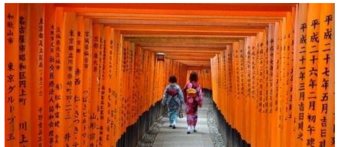
Immer ein Erlebnis: Besuch des Fushimi Inari-Schreines

Di 19.01.27 + Di 02.02.27 / 5. Erlebnis-Tag: Heute unternehmen wir einen Tagesausflug in die Nähe vom Mt. Fuji – dem heiligen Berg. Wir fahren nicht in den Hakone Nationalpark (wie bei unserem Reise-Programm „Höhepunkte von Japan), sondern nach Kawaguchi-ko und kommen somit viel näher an den Mt. Fuji heran. In den Wintermonaten ist die Wahrscheinlichkeit sehr groß, daß sich der 3777 m hohe Berg mit Schneehaube bei bester Sicht zeigt. Rückkehr nach Tokyo und Übernachtung in unserem Hotel in Ginza.