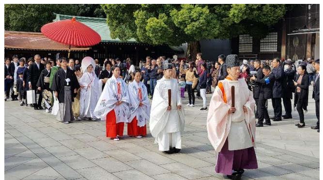
Hochzeit im Meiji Schrein

Sa 16.01.27 + Sa 30.01.27 / 2. Erlebnis-Tag Ankunft am Flughafen Narita oder Haneda. Fahrt nach Tokyo, Check-In im Hotel im Stadtteil Ginza und Übernachtung in Tokyo.