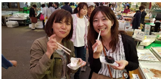
Austern und Seeigel ganz frisch ... im Ohmicho-Markt von Kanazawa

Mi 20.01.27 + Mi 03.02.27 / 6. Erlebnis-Tag: Heute unternehmen wir einen Ganztagesausflug nach Nikko . Gleich nach Kyoto steht die „Barockstadt“ Nikko auf unserer „Best of Japan“-Liste ganz weit oben. Die Tempelanlagen von Nikko gehören - völlig zu recht - zum Weltkulturerbe der UNESCO. Eingebettet in eine malerische Berglandschaft bieten die verschiedenen Tempel Fotomotive in Hülle und Fülle. Wir fahren mit dem Shinkansen von Tokyo nach Utsonomiya und dann weiter mit einem Regionalzug nach Nikko. In Nikko besuchen wir die Shinkyo-Brücke, den großartigen Toshuga-Schrein, und den Rinno-ji-Tempel (dessen jahrelange Renovierung jetzt abgeschlossen ist) oder als Alternative gleich gegenüber einen schönen japanischen Garten.